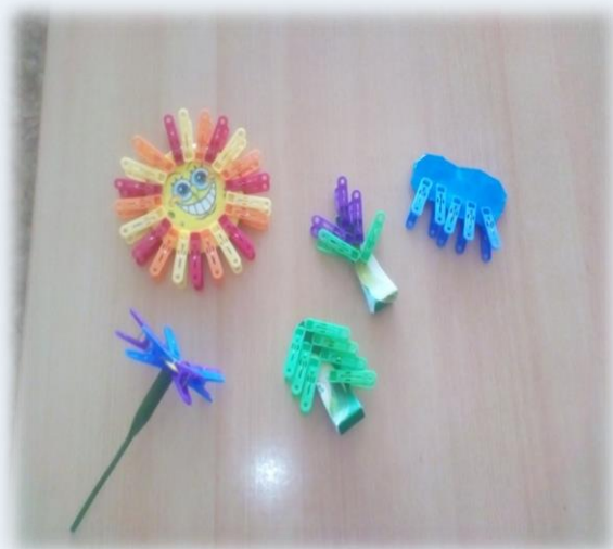
«Подбери нужную цифру»