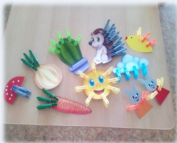
«Узнай чего не хватает»