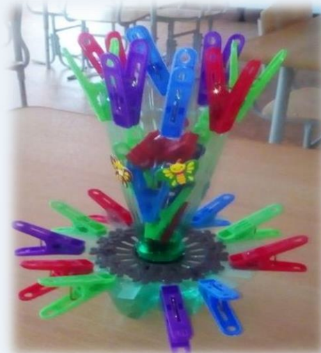
«Придумай свою поделку»