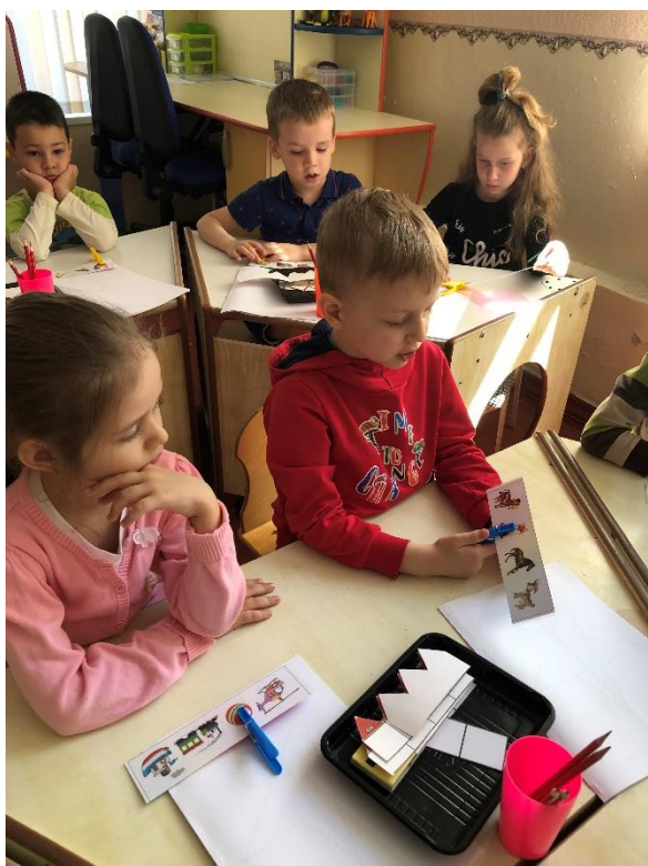
(фото №5) Дидактическая игра «Четвертый- лишний»

Дидактическая игра «Четвертый- лишний». (Формирование логического мышления. Обобщающих понятий по пройденным лексическим темам)