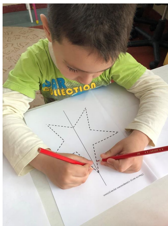
(фото №6 Работа в тетради)

Воспитатель: следующая игра называется «Четвертый-лишний». Определите, какой предмет лишний и закройте его прищепкой. (Дети выполняют задание.) Кто хочет объясните почему ваш предмет лишний. (Дети по желанию объясняют. У меня лишняя бабочка, потому что стол, диван и шкаф — это мебель, а бабочка насекомое.)