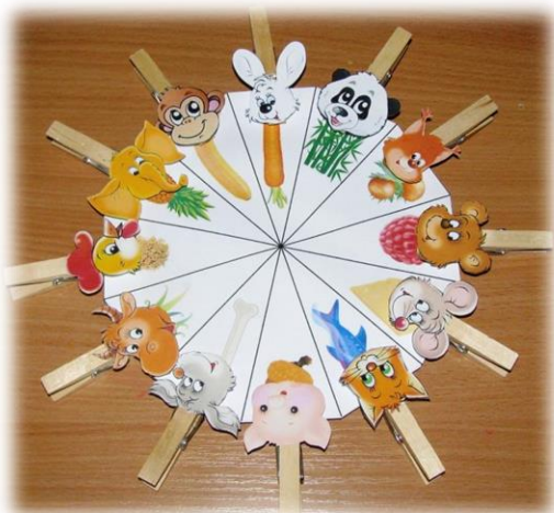
«Кто, что ест?»