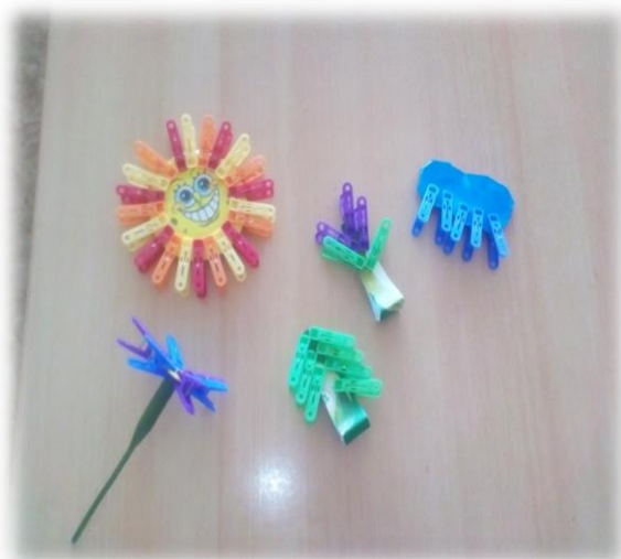
«Подбери нужную цифру»