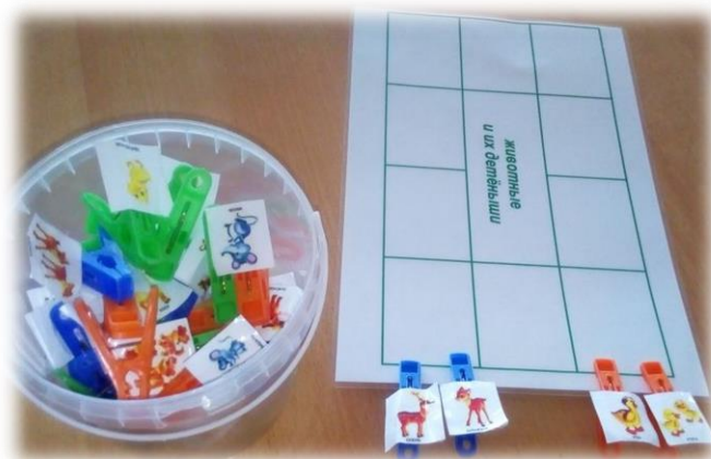
«Кто чья мама»