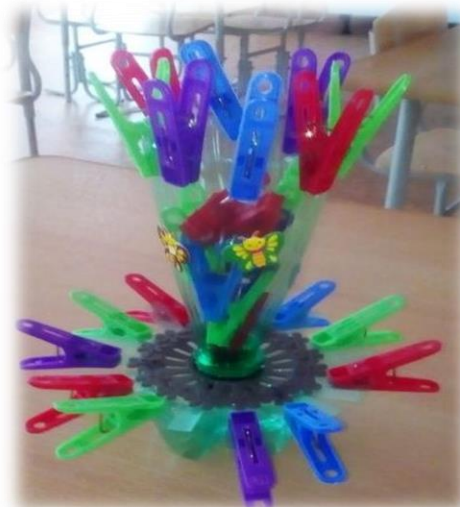
«Придумай свою поделку»