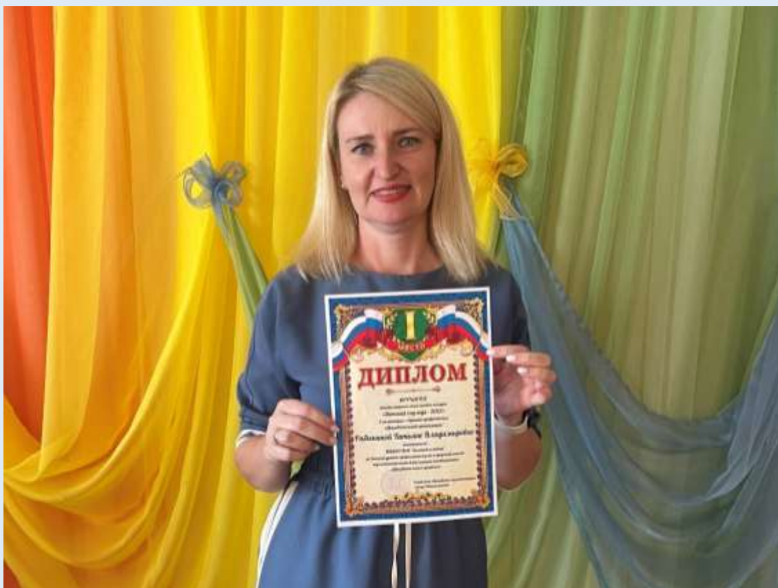
Городской этап краевого конкурса «Детский сад года-2023». I Место