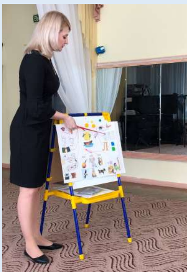
Консультация для педагогов ДОУ на тему: «Интеллект карта в образовательном процессе учителя-логопеда»