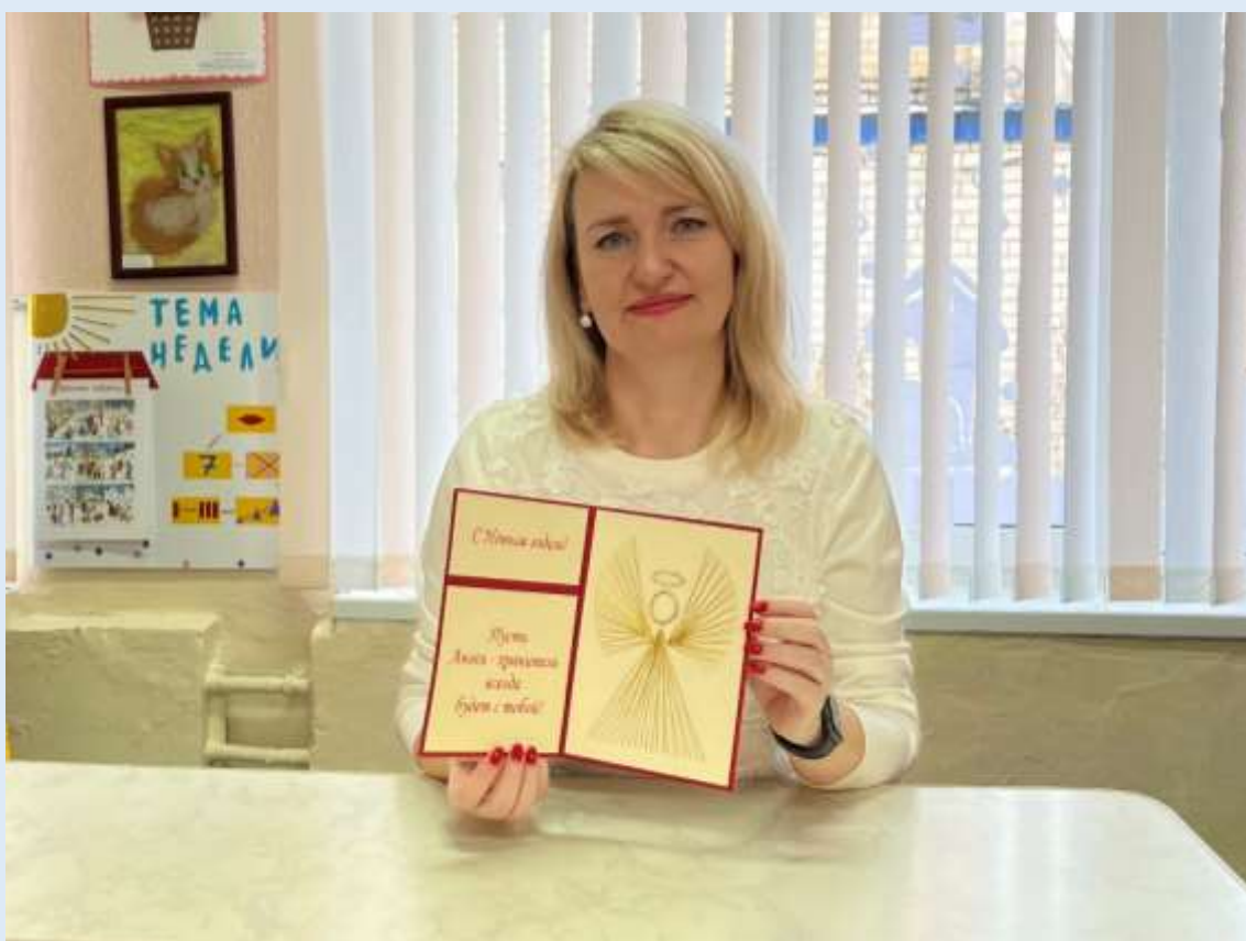
Участие в городской акции «Новогодняя открытка»