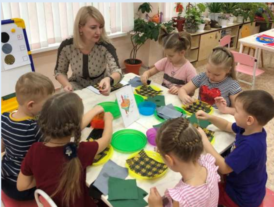
Проект «Такие разные ткани»