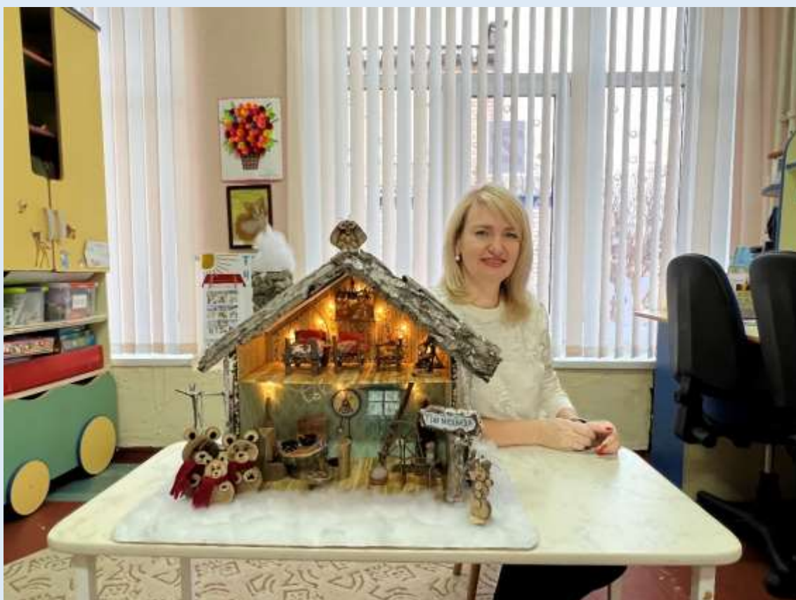
Городской конкурс «Рождественская сказка». Диплом за I место