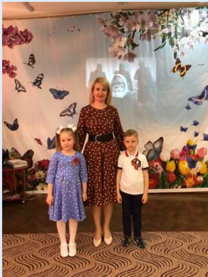
Конкурс чтецов ко Дню Победы