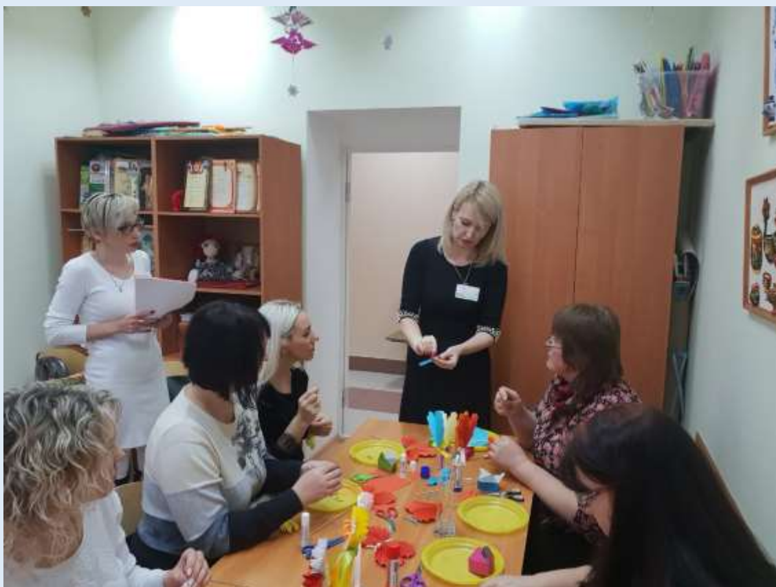
Городской фестиваль педагогического мастерства «Лавка мастеров»