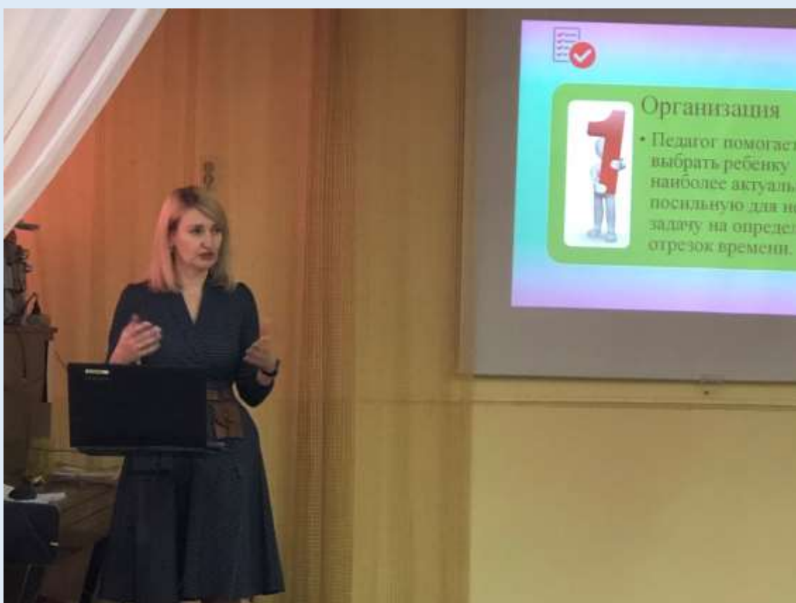
Консультация педагогам ДОУ на тему: «Структура построения проекта»