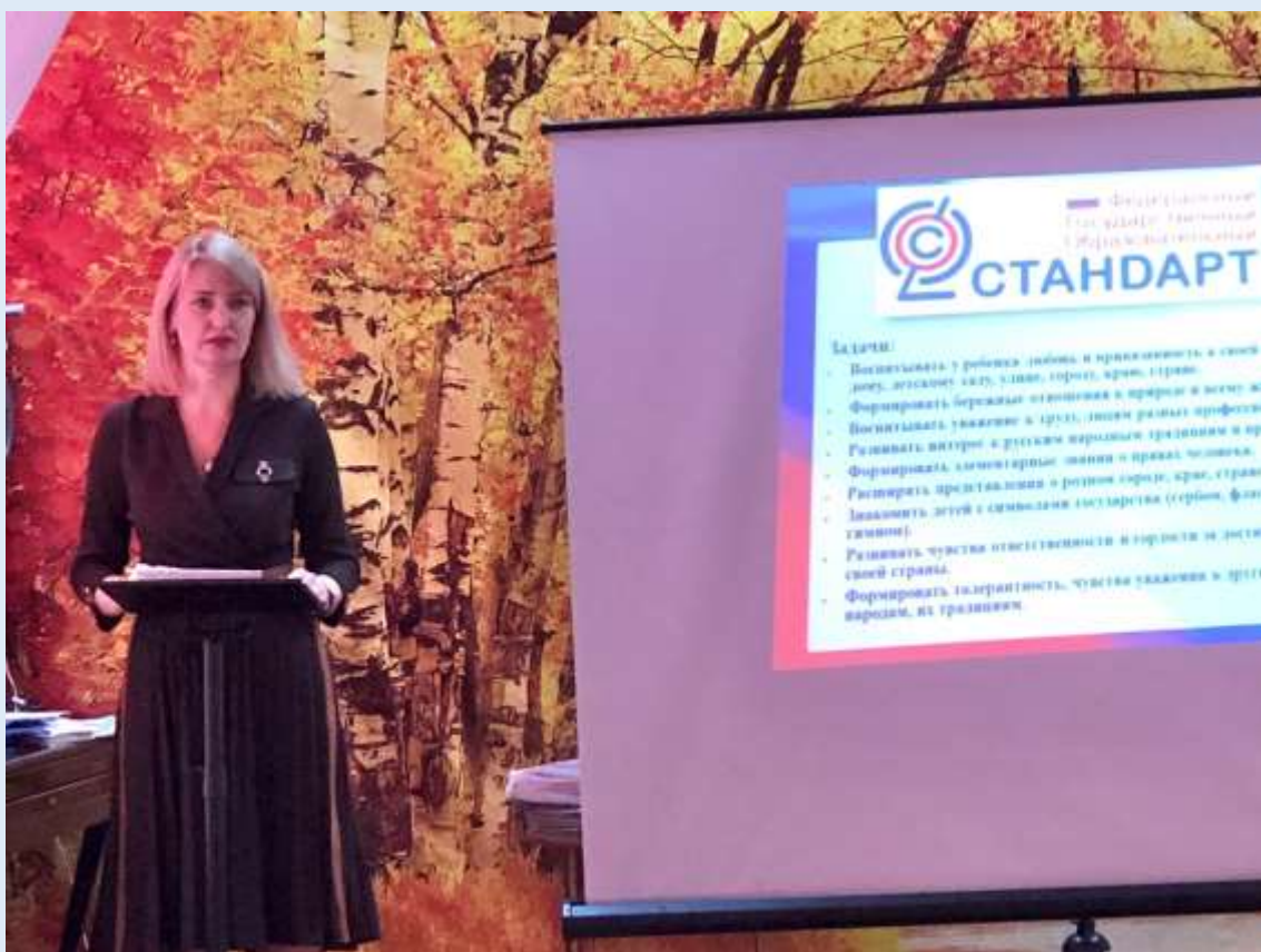
Презентация для педагогов ДОУ на тему: «ФГОС ДО и бельевые прищепки»