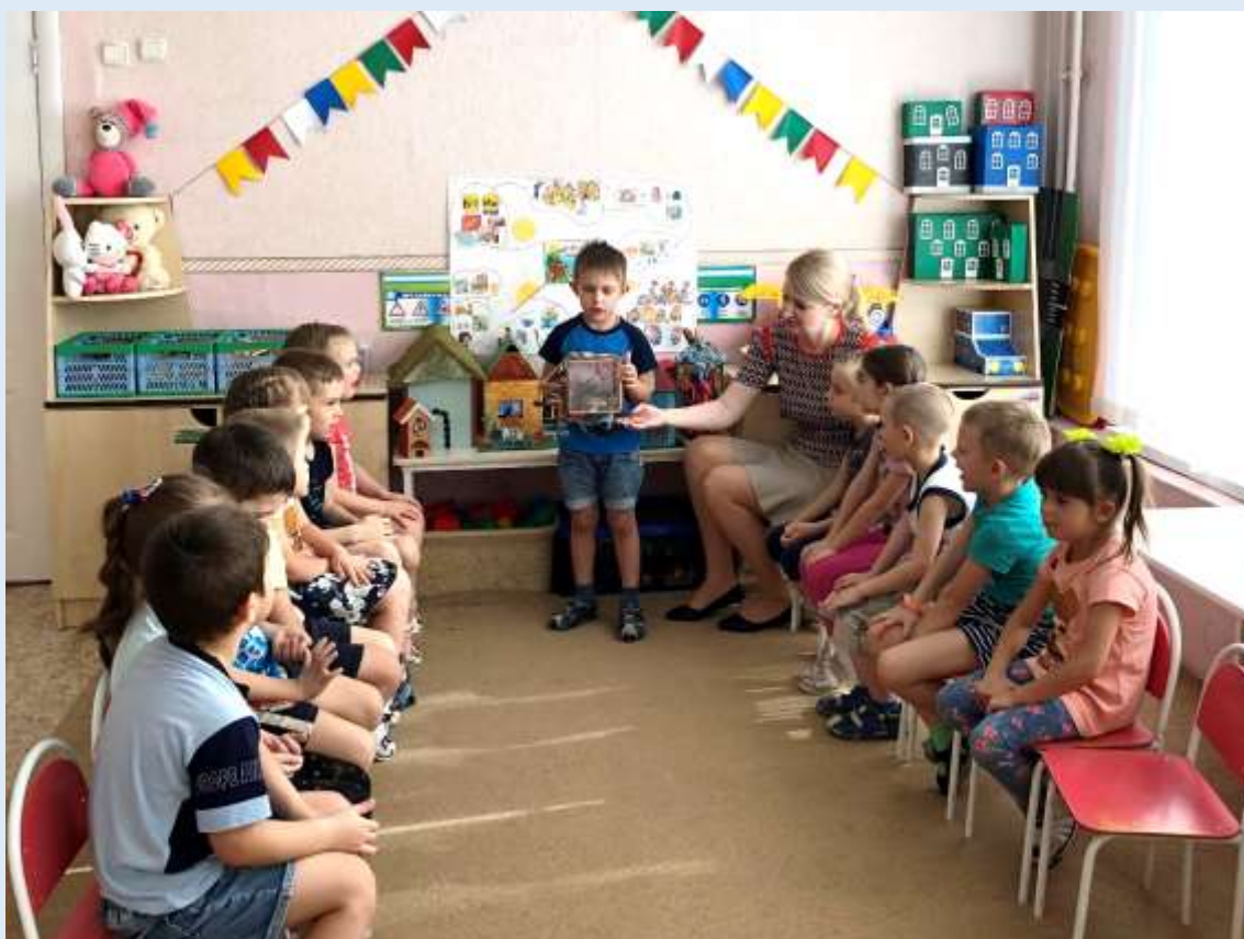
Проект: «Дом моей мечты»