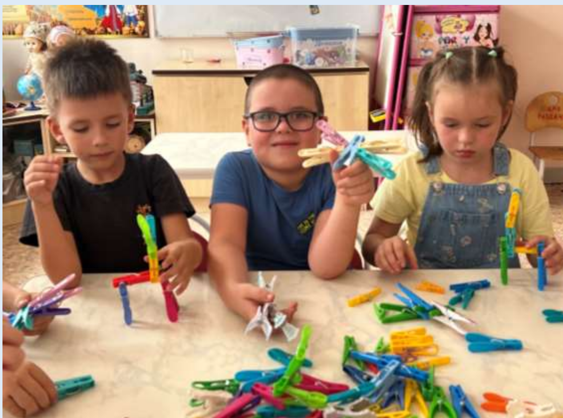
Конструирование из прищепок