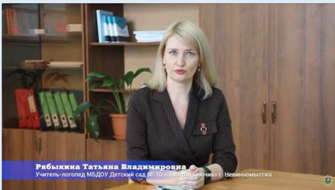
Интервью в НГГТИ «Дорога в профессию»