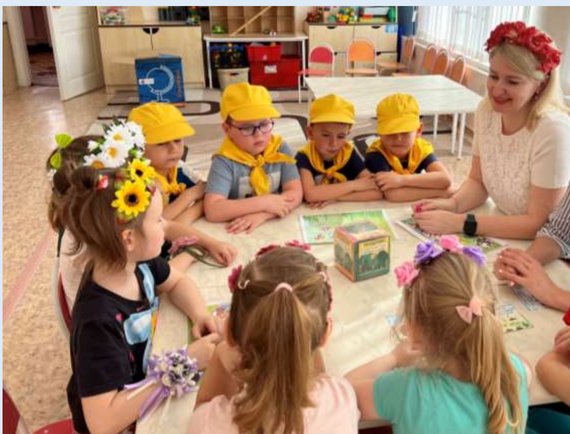
Всероссийская акция «Юные эколята-дошколята»