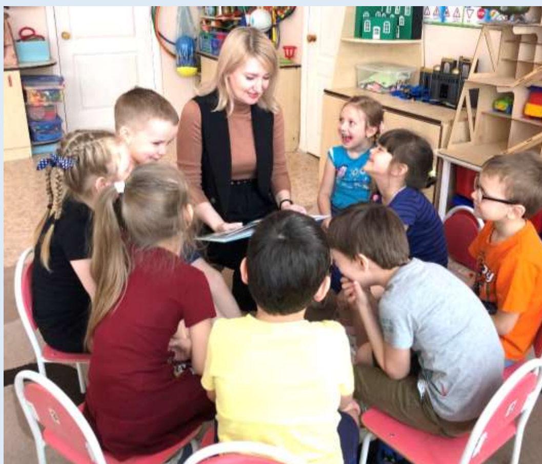
Всероссийская экологическая акция «Подари книгу»