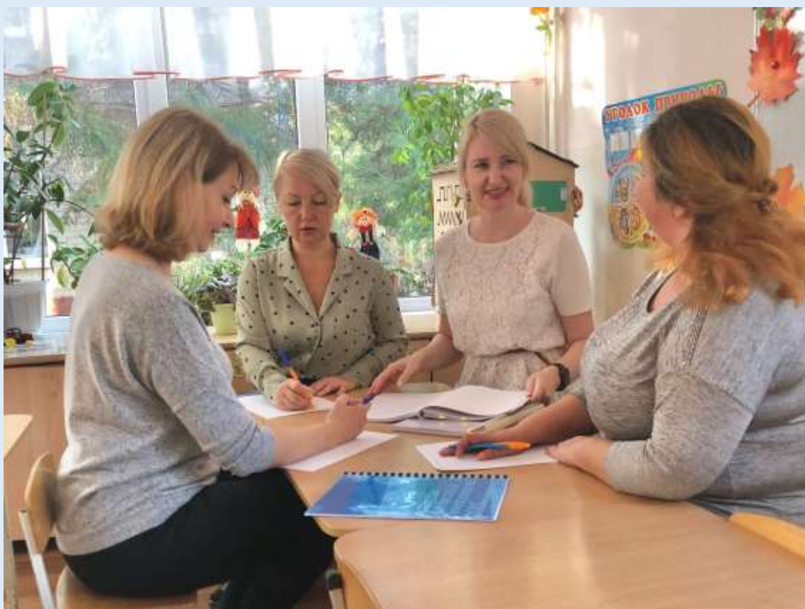
Наставничество. Работа с молодыми педагогами