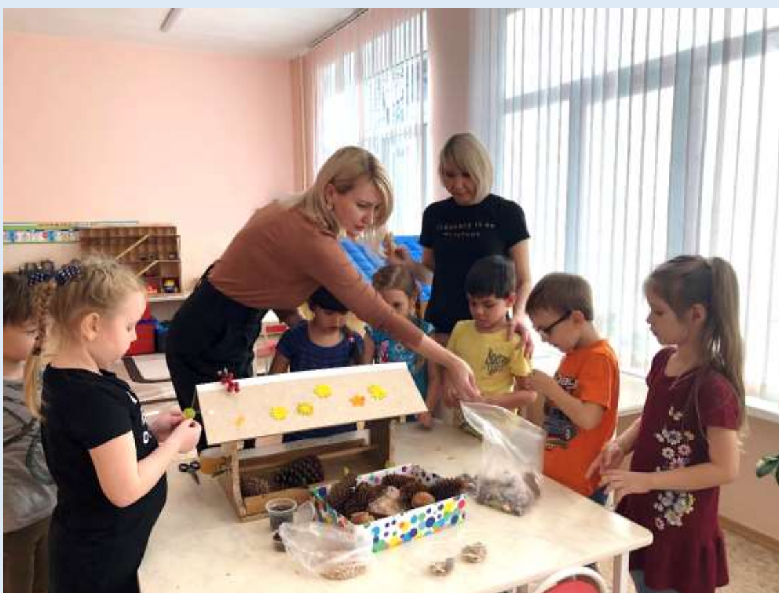
Краевая акция «Покорми птиц»