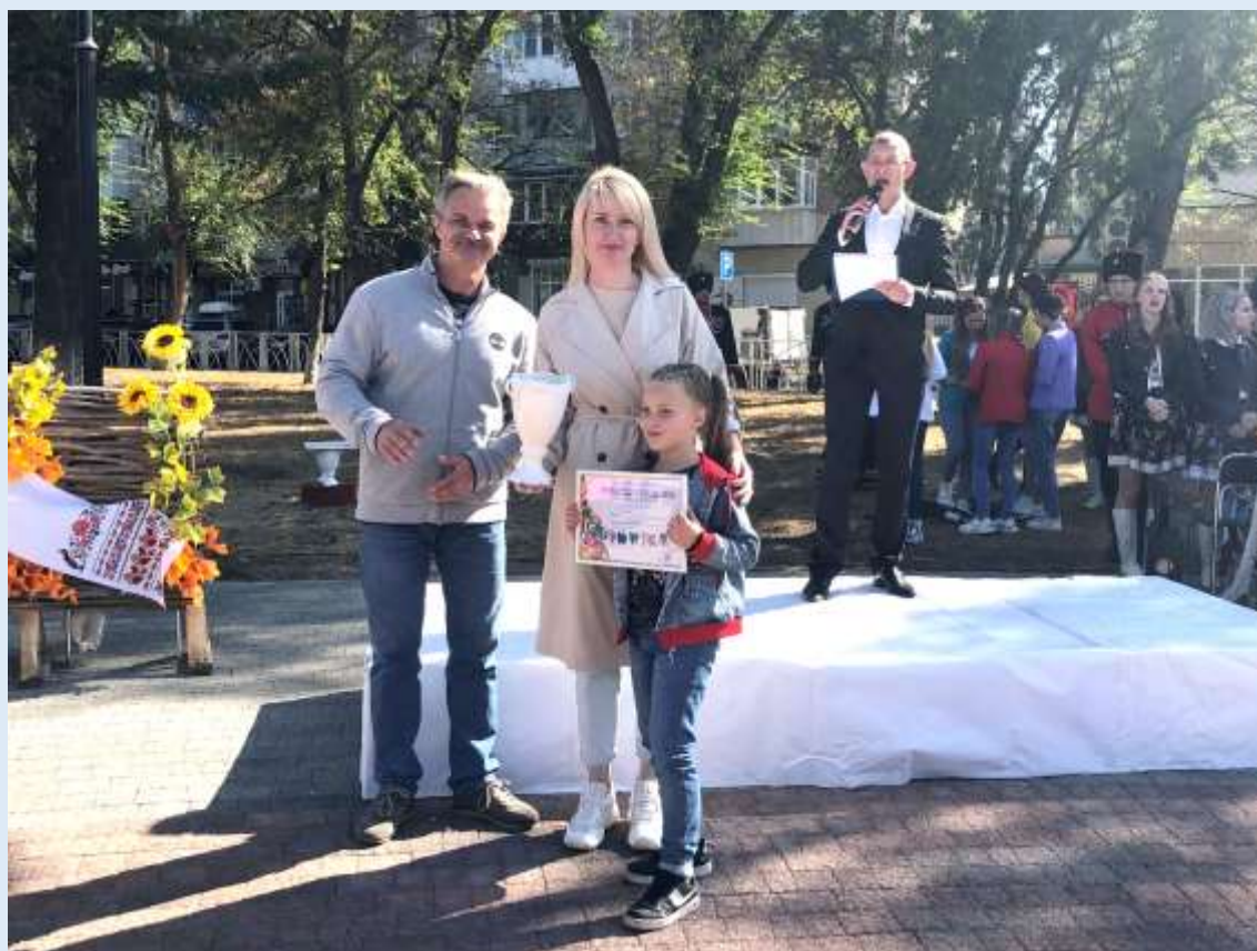
Лауреат городского конкурса «Невинномысская весна – 2021»