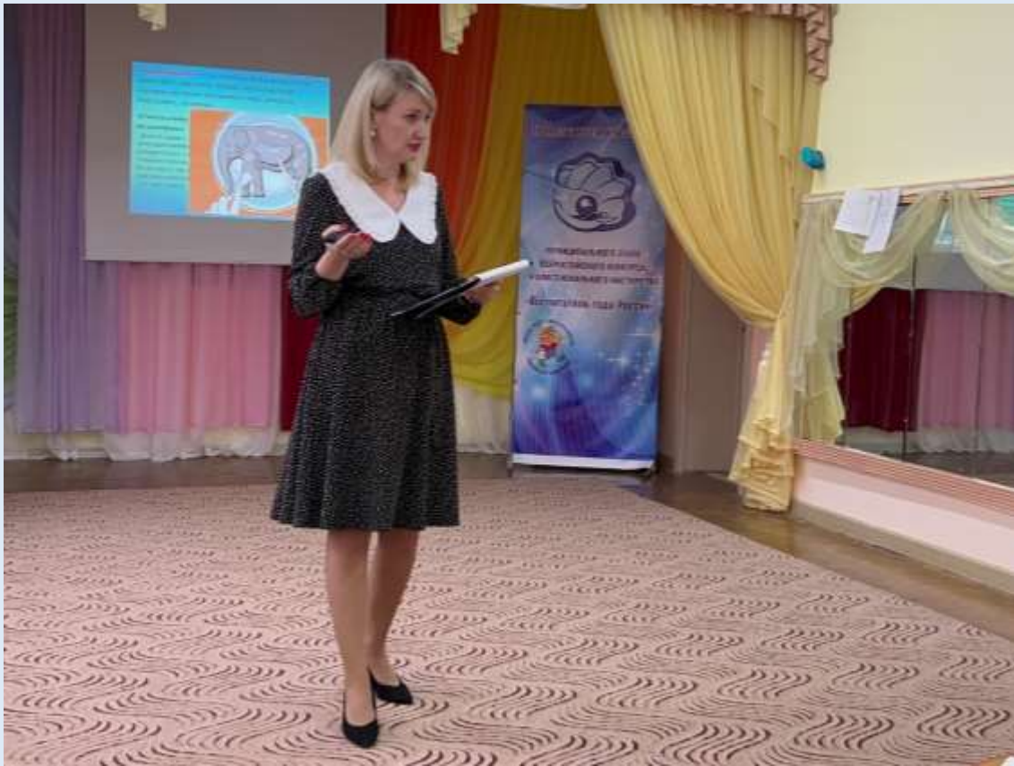
Мастер-класс для педагогов ДОУ на тему: «Тайм-менеджмент современного педагога»