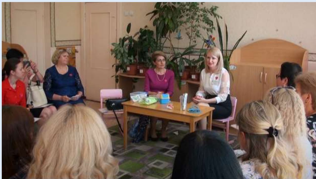
Городской семинар-практикум. Мастер-класс