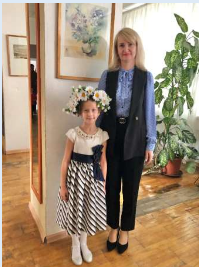
Выступление на выборах 2021 года со стихотворением «Ромашка»