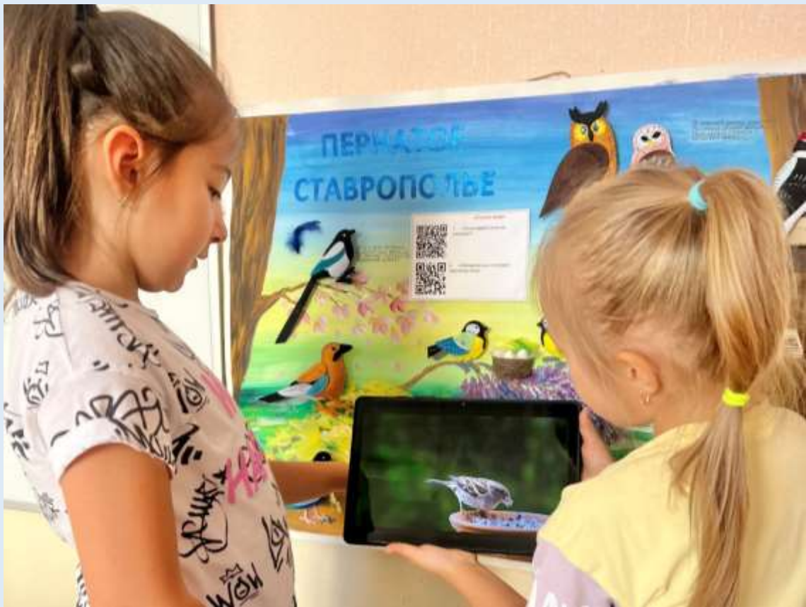
Проект «QR-код и прищепки в образовательной деятельности»