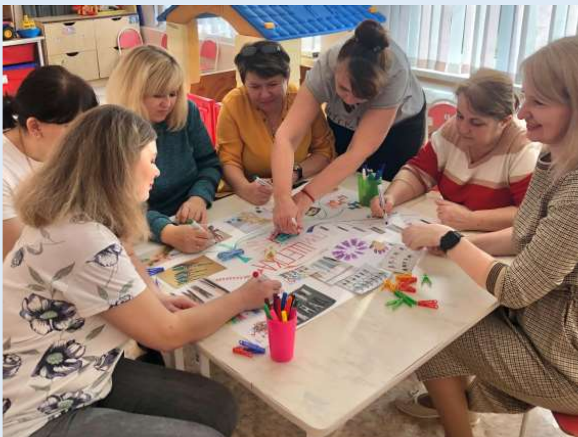
Сотрудничество с родителями. Проект: «История прищепки»