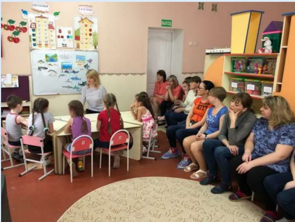
Рабочий показ занятия по теме: «Рыбы». Развитие критического мышления