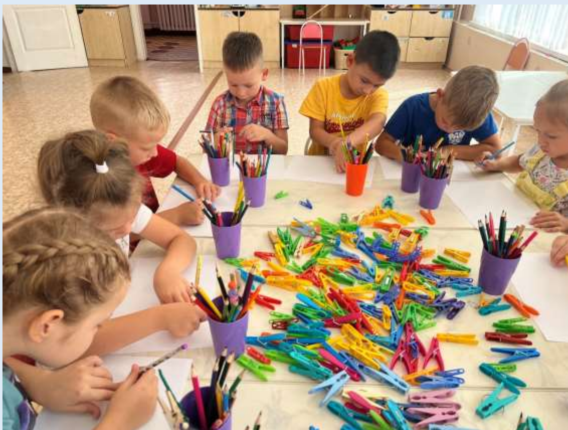
Творческое рисование с помощью шаблона прищепки