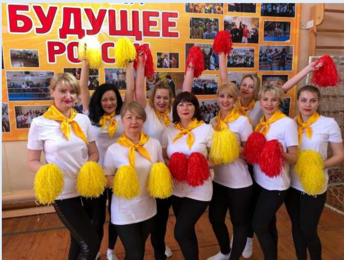
Городской конкурсе «Красота и грация»