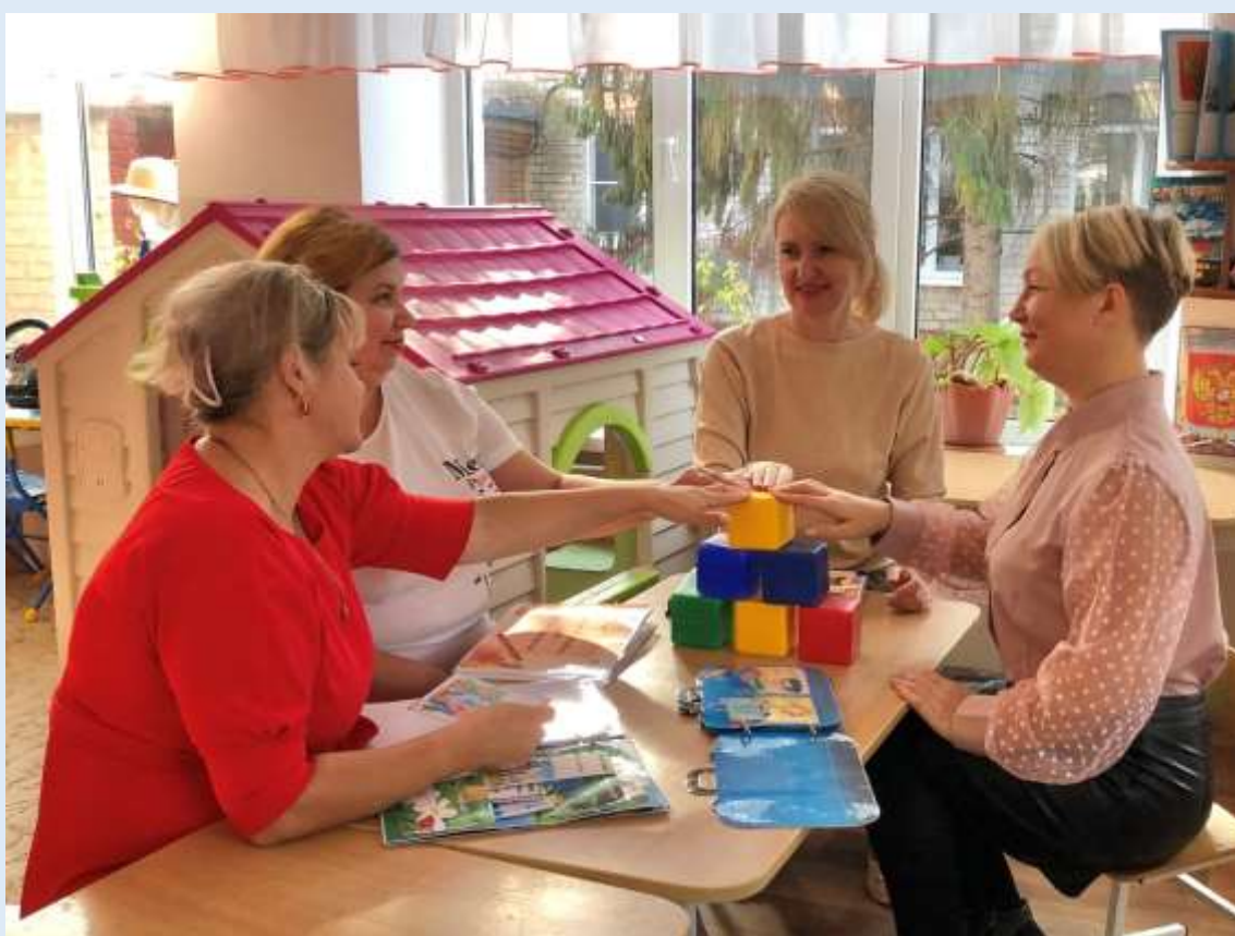
Наставничество. Формирование успешности