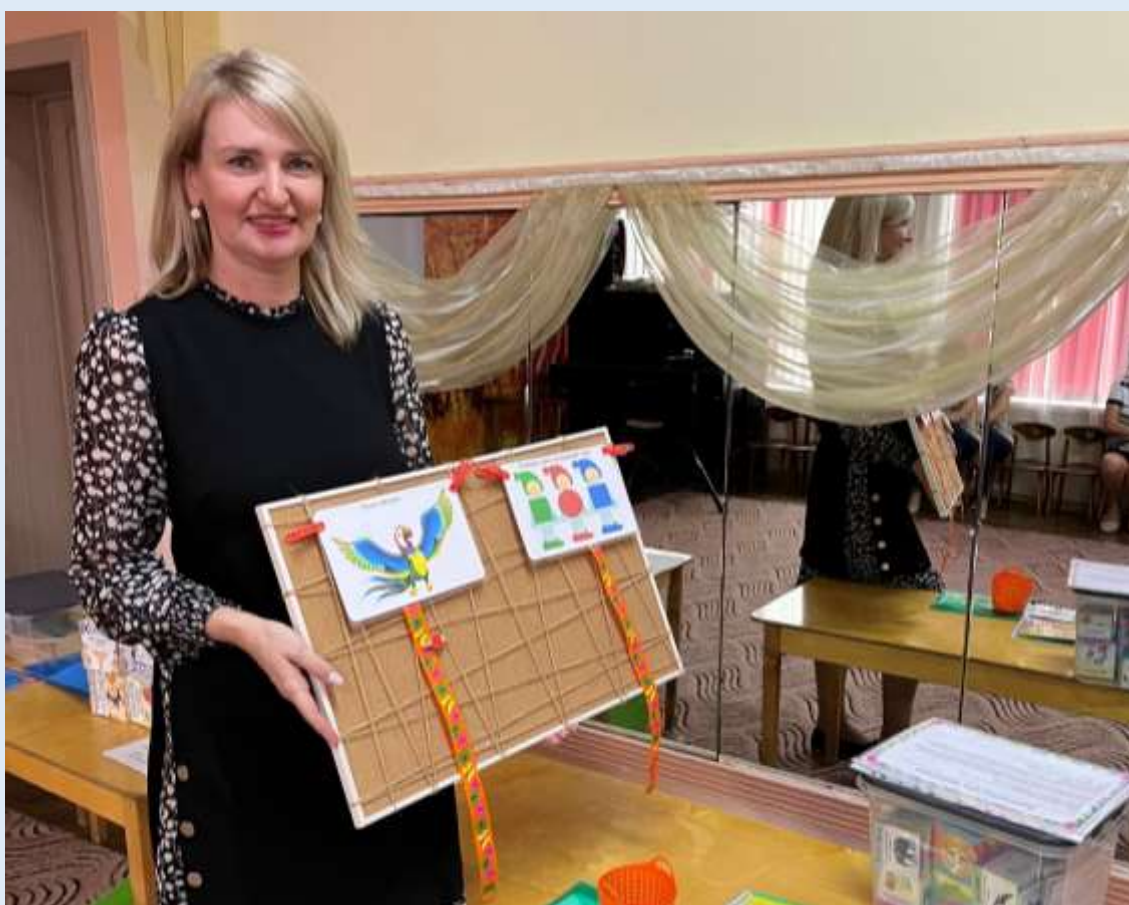
Презентация методических продуктов для педагогов ДОУ «Говорящая среда»