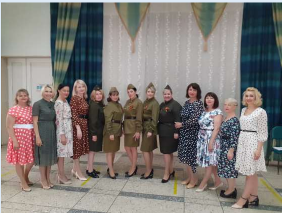
Участие в городском конкурсе «Невинномысская весна – 2021»