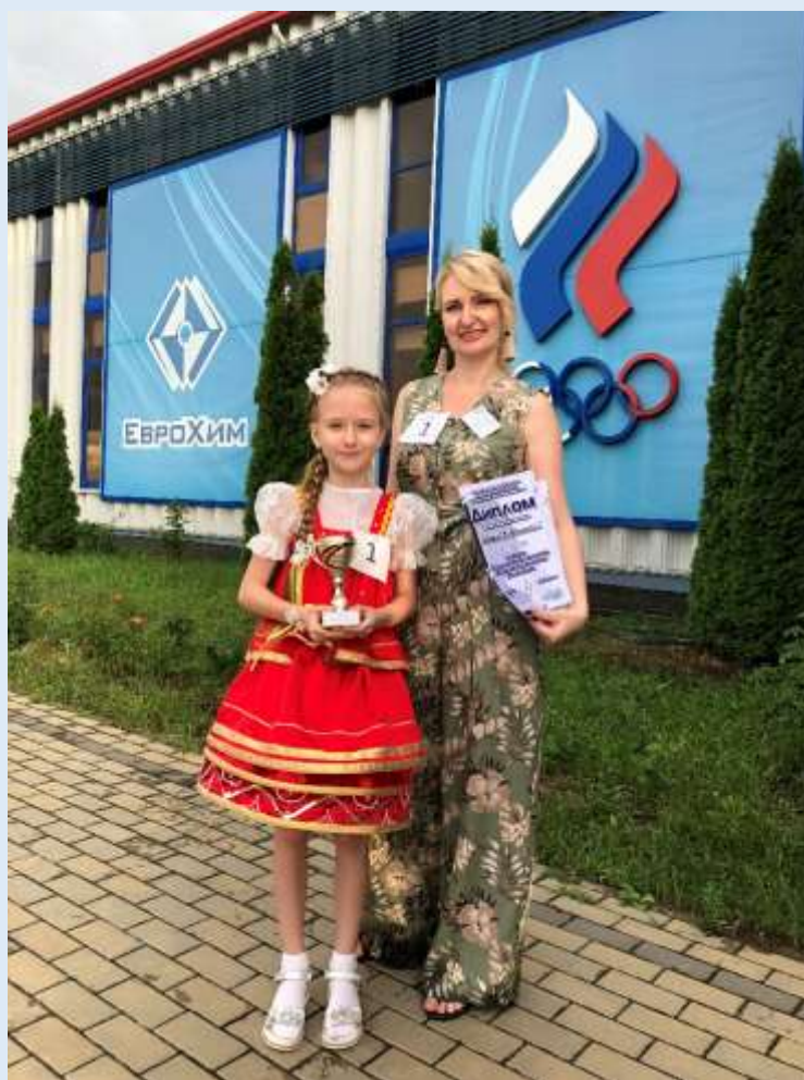
Городской конкурс «Варвара краса – длинная коса». Диплом за I место