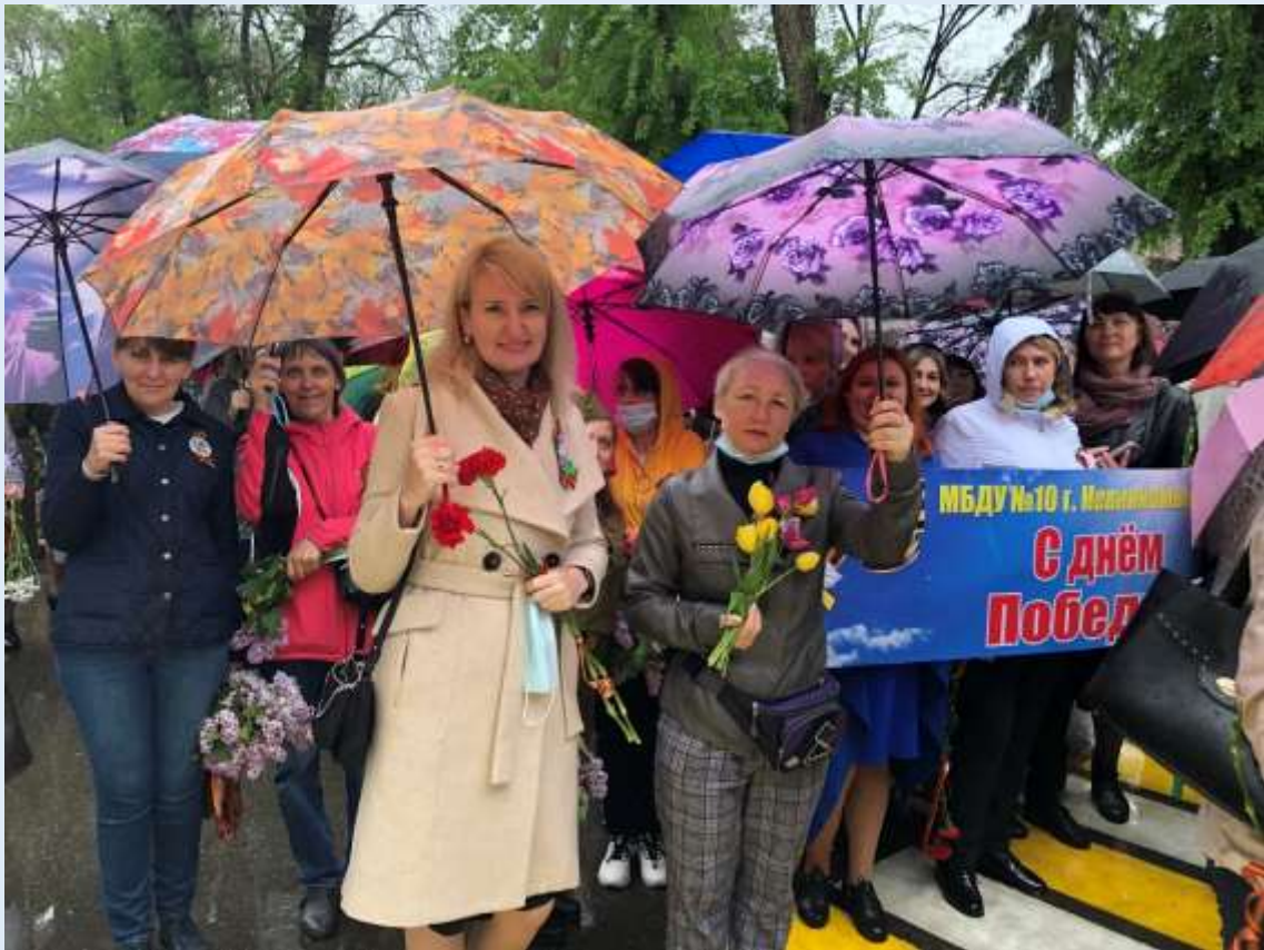
Городское мероприятие. День Победы