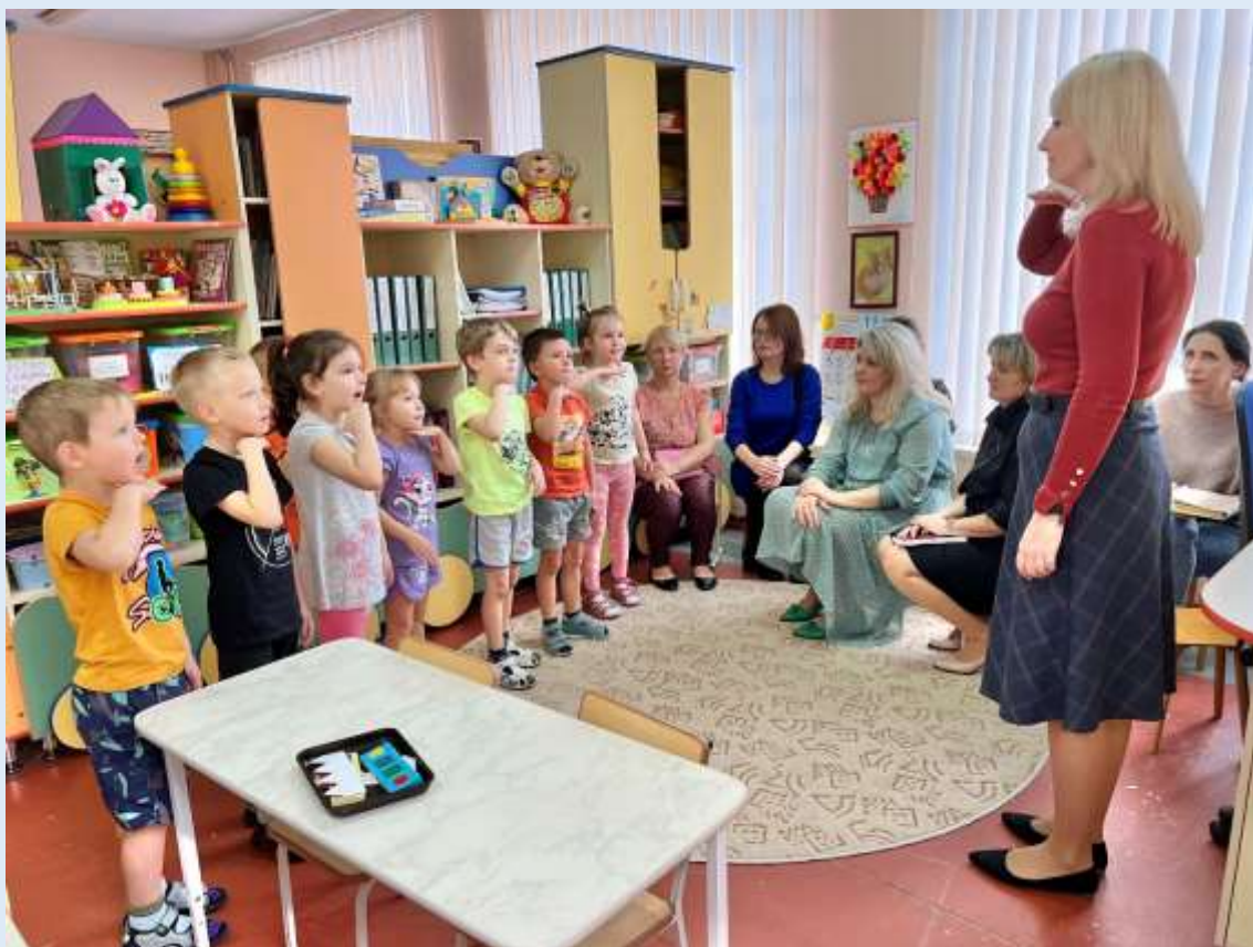
Городское открытое занятие для учителей-логопедов «Я-выбираю!»