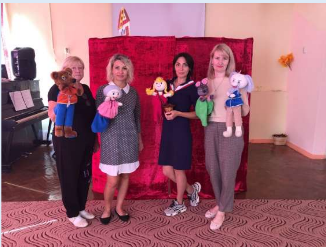
Постановка кукольного спектакля: «Сладкая конфета»