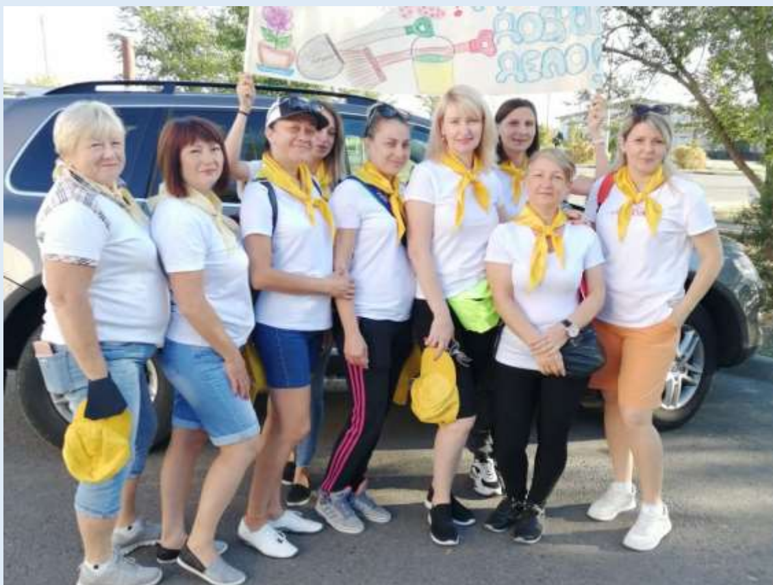
Городской субботник. Это – просто!