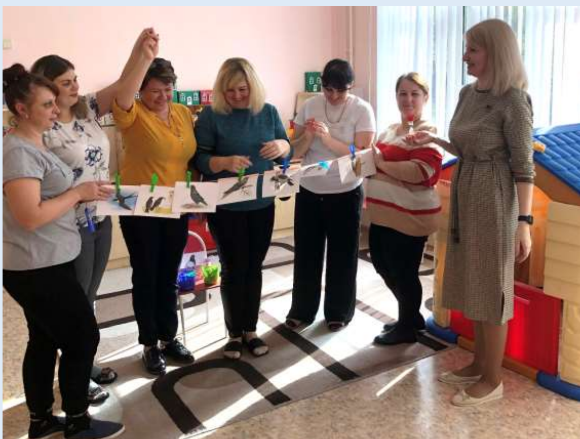
Взаимодействие с родителями: «Птиц сегодня изучаем и прищепками играем»